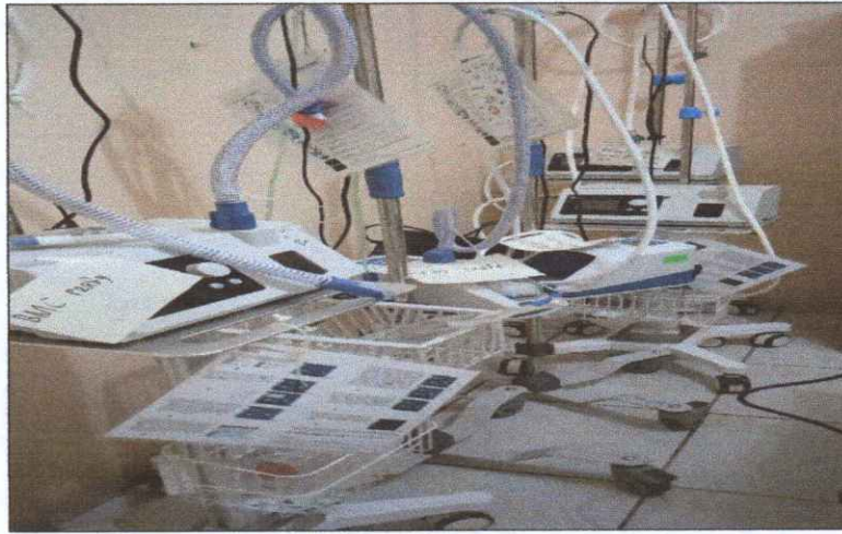
High Flow Humadifier (HFNC) H-80