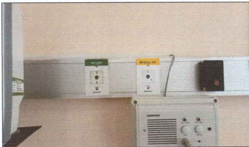
Instalasi Gas Medis RSUD Muntilan di ruang Dahlia